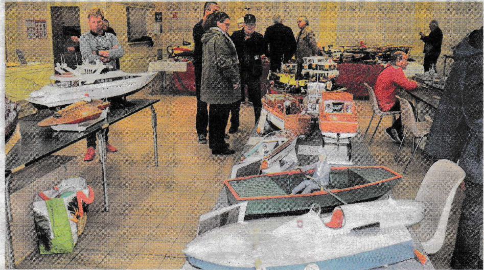
Une exposition bien suivie le dimanche.

L'association se réunit le mercredi après-midi et le samedi matin dans une salle mise à disposition par la municipalité. Les vols et la navigation sont possibles les samedis et dimanche après-midi.